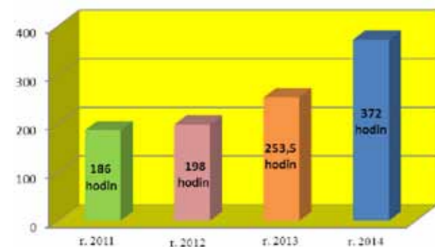
Hodinová dotace jednorázových akcí v r. 2011 – 2014

ci úrazů způsobených psem • 22 akcí ve zdravotně-sociálních zařízeních pro děti a dospělé • 9 akce ve zdravotně-sociálních zařízeních pro seniory • 3 akce v nemocničním zařízení • 14 akcí spojených s návštěvou na bytech, táborech • 14 aktivit prezentačního charakteru