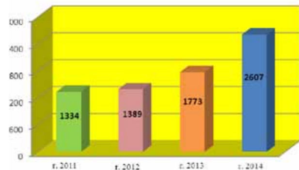
Počet účastníků jednorázových akcí r. 2011 – 2014